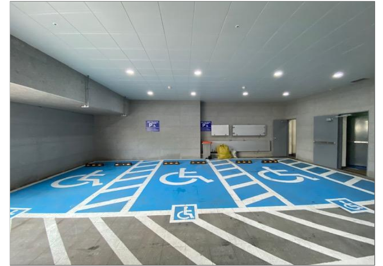
< 장애인 주차구역 >