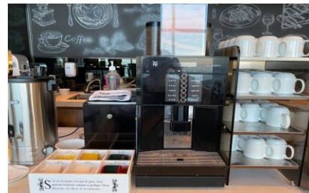
커피 / 차