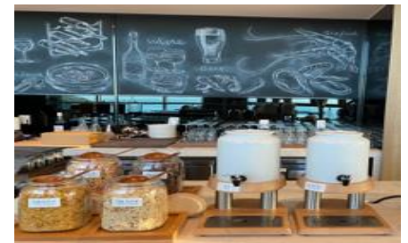
씨리얼 / 우유