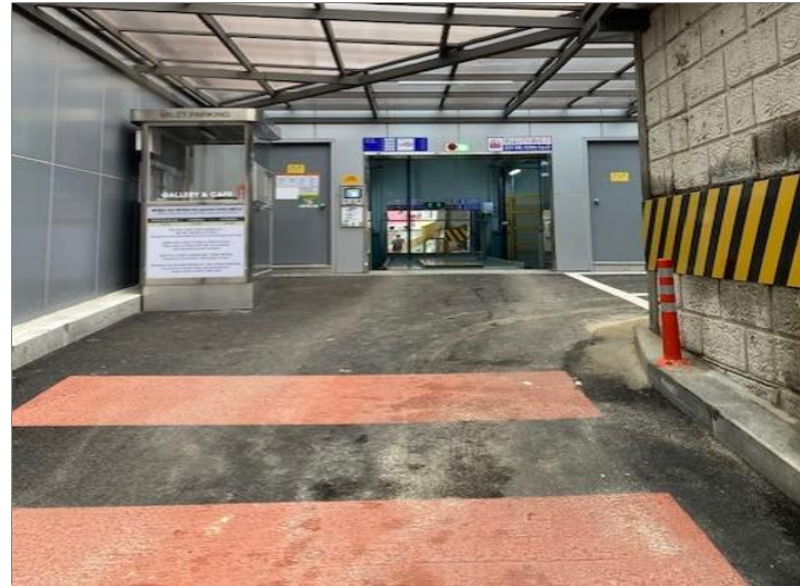
< 주차장 입구 사진2 >