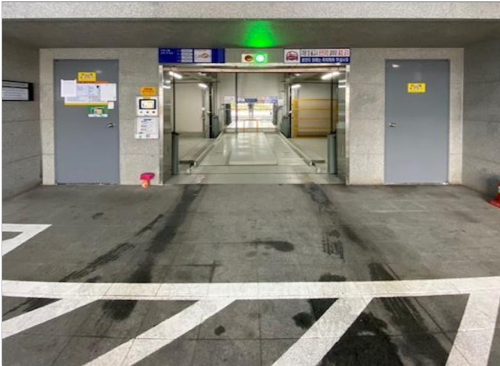
< 주차장 입구 사진/ 스톱퍼 설정 >