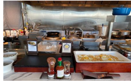
죽석코너(계란요리 / 설렁탕)